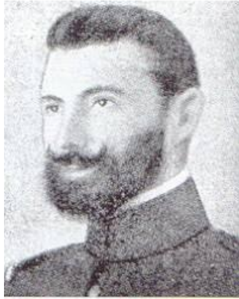
Capitán D. Enrique Amador Asín , del Regimiento de Infantería "Melilla" núm. 59, muerto el 25 de julio de 1921 al frente de la defensa de la casa de Hami Boasa.