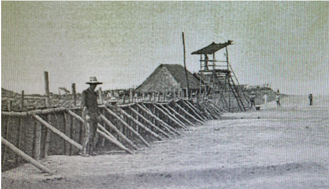
Trinchera grande de Cavite