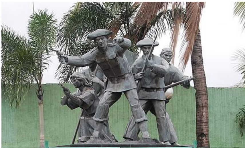
Monumento a los revolucionarios Filipinos de Binakayan (Kawit). Provincia de Cavite.

Posteriormente, por Real Orden de 30 de marzo de 1898, recibe por su acto de valentía, en esta misma acción, la Cruz de San Fernando de 2. a Clase .