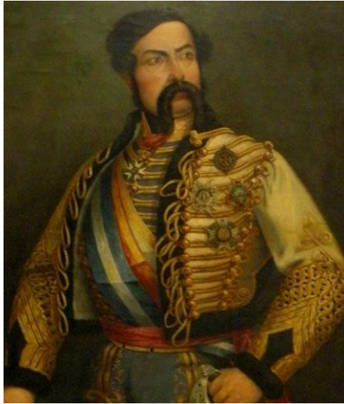
Capitán general Diego de León y Navarrete, Conde de Belascoaín, con uniforme de Húsares de la Princesa y sus laureadas

El 26 de febrero de 1863 es nombrado Comendador Ordinario de la Orden de Carlos III, Real título expedido el 3 de abril. También poseía la Gran Cruz de la Orden de Isabel la Católica.