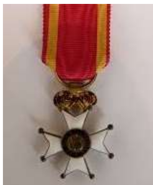
Cruz 1ª clase de San Fernando

Por Acuerdo del Tribunal Supremo de Guerra y Marina, el 15 de abril de 1868, fue colocado en el escalafón de Caballeros con opción a pensión con la antigüedad de mayo de 1857.