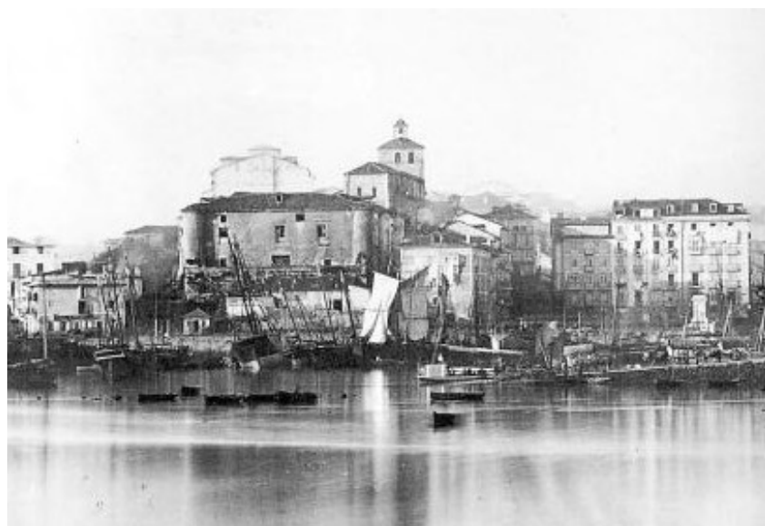
Cuartel de San Felipe (derribado a finales del XIX)

En 1854 es ascendido a segundo comandante y el 1855 es nombrado jefe del Depósito de Banderas y Embarque para Ultramar sito en Santander. En esta ciudad, en 1856, participó en la defensa del Cuartel de San Felipe que atacaron los sublevados con resultado de varios muertos y heridos. Por esta acción fue felicitado por el Gobierno de su Majestad, dado el heroico comportamiento de toda la fuerza defensora. Y concedida posteriormente la Cruz de 1ª clase de la Orden de San Fernando.