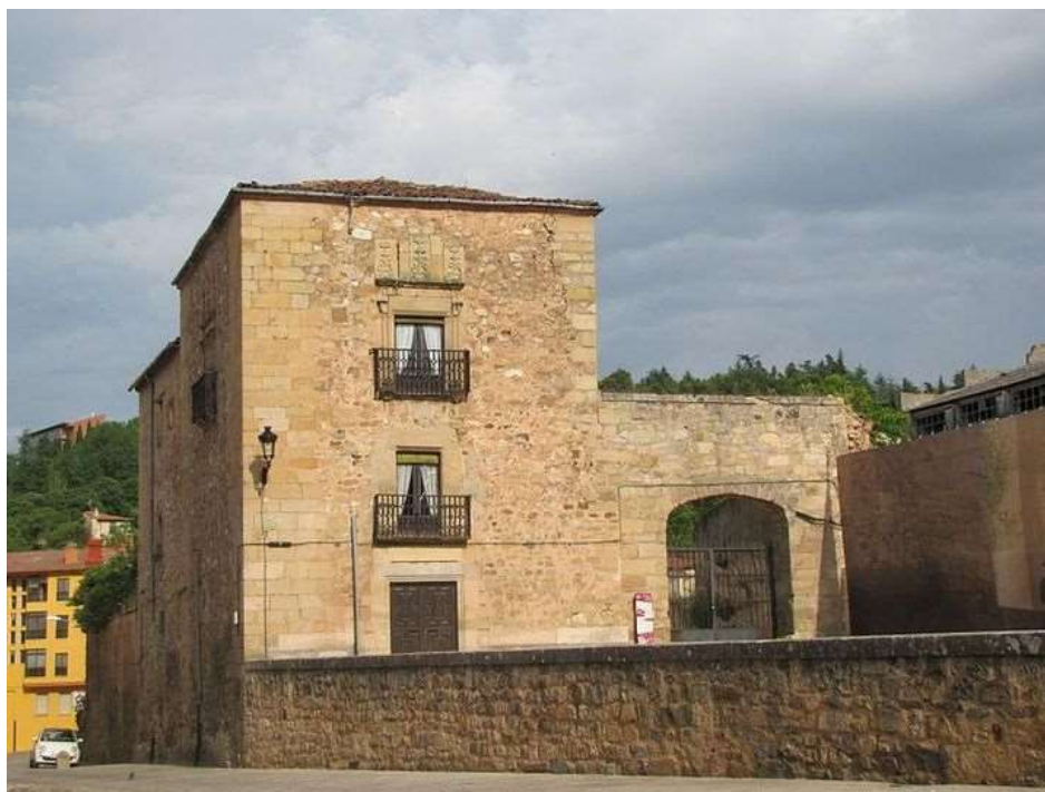
Palacio de los Beteta (Soria)

En Huerta de Ariza (Zaragoza), el 18 de febrero de 1840, sorprendió a los rebeldes y en la acción se produjeron muertos y heridos. En esta acción se rescató en el fuerte de Beteta (Soria) a dos señoras, capturadas por la facción carlista. Una de ellas era la viuda del general Iribayen.