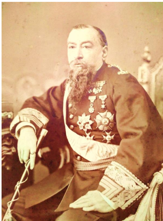
Brigadier Joaquín Vara de Rey Calderón de la Barca

Luchó en la primera guerra civil, en la que ganó una Cruz de San Fernando de 1ª clase y el ascenso a capitán por méritos de guerra, recibiendo tres heridas de bala durante la contienda.