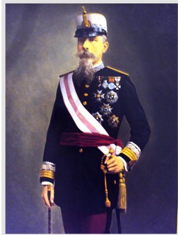
General Joaquín Vara de Rey Rubio

Volvió a entrar en operaciones de combate en 1895, esta vez en Cuba y al frente del Regimiento de este nombre, con el que ganó en el mes de julio el empleo de general de brigada. Destacó en la pacificación de la isla recibiendo diversas condecoraciones siendo trascendente la Operación de la Loma del Gato, en julio de 1897 donde cayó el cabecilla José Maceo.