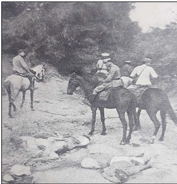
Entrada de la Cueva de Ruman, varios defensores muertos en la entrada, al borde del Rio Lucus.