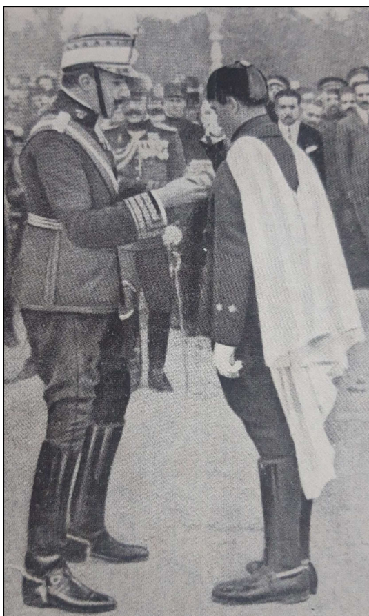
El Rey Alfonso XIII, imponiendo a Varela, las 2 Laureadas, en la Plaza de España (Sevilla)

el combate, la vanguardia recibe fuego de nuevo, pero esta vez el Teniente Varela que mandaba una compañía, solicita autorización al Tte Coronel Gonzalez Carrasco para tomar la posición enemiga y así poder progresar. El Teniente Varela realiza en solitario un reconocimiento descubriendo el lugar exacto desde donde provenían los disparos, era un trincerón o cueva natural, situada en la ribera derecha del Rio Lucus, cerca de Muires y Ruman.