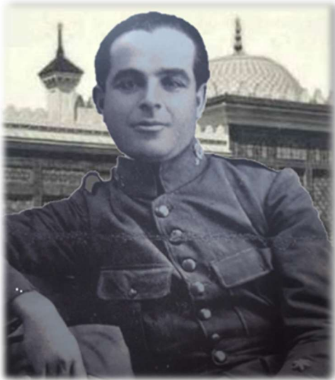
Teniente José Enrique Varela