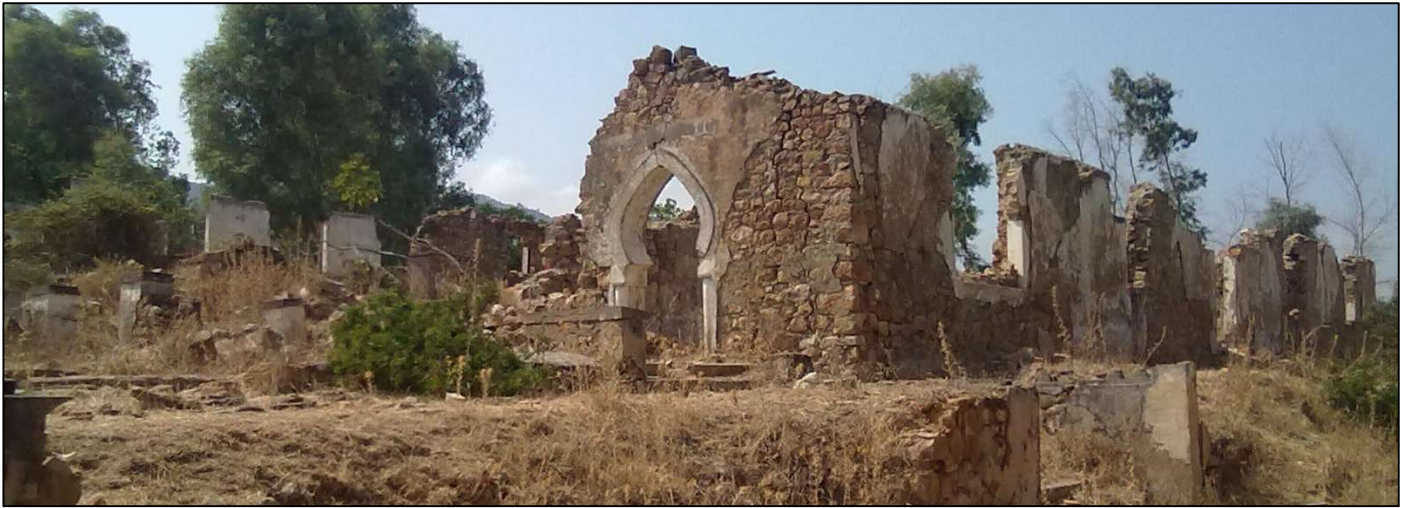
Restos del Campamento de Teffer, Valle del, ribera derecha del Rio Lucus (Sector de Larache)